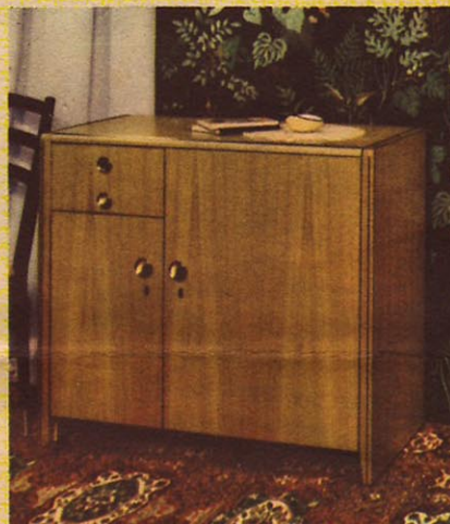
Die elegante ZUNDAPP-Nähtruhe 51 gehört zu den gefragtesten Nähmaschinen-Möbeln. Wertvolle Ausstattung, ungewöhnliche Geräumigkeit und sinnvolle Einrichtung machen die Truhe allen Ansprüchen gerecht.

Der ZUNDAPP-Nähschrank 96 ist mehr als ein reines Zweckmöbel. Als Nähmaschinen-Möbel bietet er große Arbeitsfläche und günstige Abstellmöglichkeiten für Flickwäsche und Näh-Utensilien.