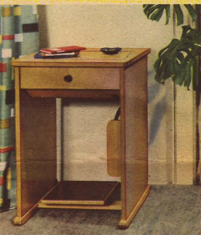
Das Raumsparmöbel 32 ist eine zweckmäßige Ergänzung des schönen Heims und kann überall stehen. Die schlichte, gute Form gefällt und wurde deshalb schnell beliebt. Es ist eines der meistgekauften Möbel.