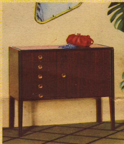
Die Elcona-Truhe 60 ist das elegante, praktische Nähmöbel für die moderne, elektrische Koffernähmaschine. Sie bietet eine große Arbeitsfläche beim Nähen und bewahrt die Nähmaschine mit Koffer unauffällig, staubgeschützt auf.