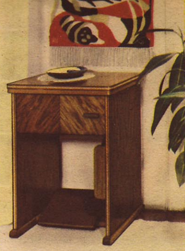
Die geschmackvolle Form des ZUNDAPP-Näh-tisches 73 paßt sich harmonisch der Umgebung an. Genau so zweckmäßig wie im Heim der Hausfrau steht der Tisch im Atelier der Damenschneiderin.

Erstklassige Verarbeitung ist allen ZUNDAPP-Nähmaschinen-Möbeln eigen. Sie sind von ersten Möbel- und Innenarchitekten entworfen, aus bestem Holz und edlen Furnieren von erfahrenen Fachleuten sorgfältig gebaut. Jedes ist in seiner Art ausgereift und zweckmäßig schön gestaltet.