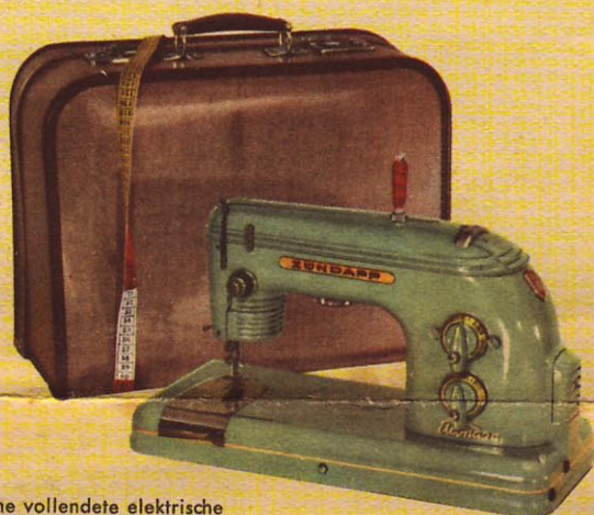
ZUNDAPP-Elcona 2a, eine vollendete elektrische Universal-Zick-Zack-Koffernähmaschine.

Der Kauf einer Nähmaschine ist Vertrauenssache. ZUNDAPP hat als erste Firma in Deutschland die Nähmaschine modernisiert. Ein umfassendes Programm ausgereifter Nähmaschinen, von der einfachen Geradstich-Nähmaschine, die später zur Zick-Zack erweitert werden kann, bis zur vollendeten Automatic, der Spitze der Nähtechnik, erfüllt jeden Wunsch.